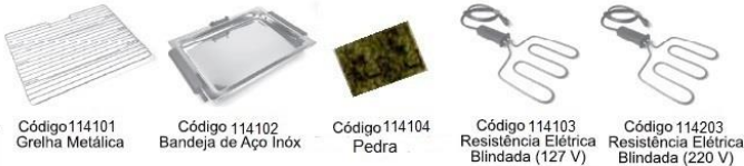
Código 114101 Grelha Metálica